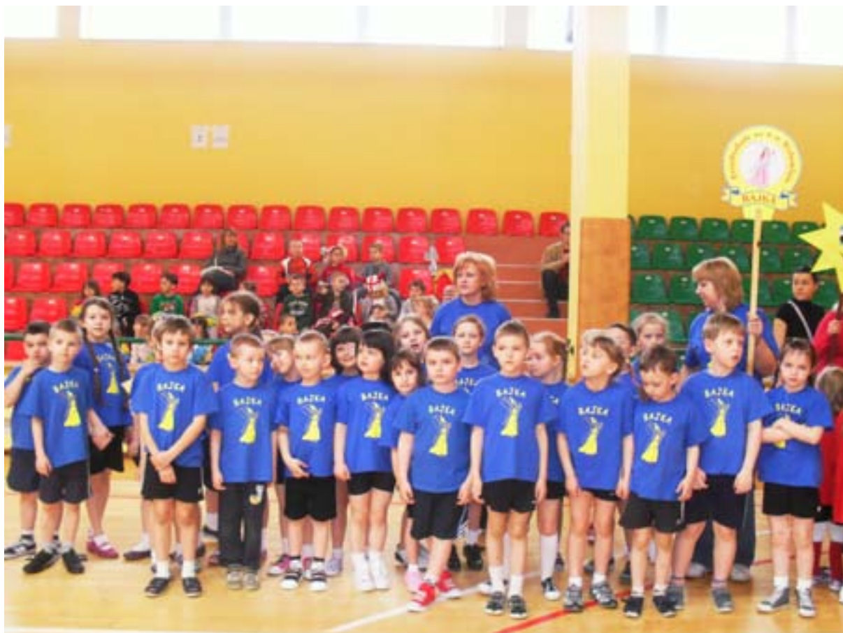
Jeszcze tylko pamiątkowe zdjęcia